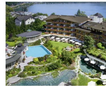
Gartenanlage, Hotel Salzburgerhof, Zell am See

Die Hotelkosten sind im Ayurvedakurpreis NICHT inkludiert. Hotelpreise rechts> Kurinfo: +43 / (0) 1 40 555 87